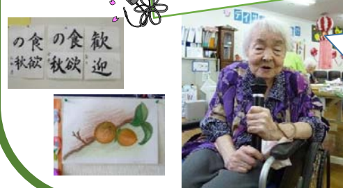
カラオケが好きなあなたはこちらですよ！大きな声と一緒に楽しく歌いましょう！