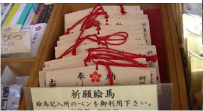
おまもりもいろいろあって迷いますね