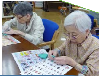
フィッシュねんどクラブ