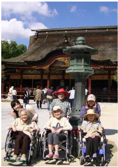
みんなでお参りをしました。

秋の風が心地よくなってきた10月、毎年恒例の皆さんと太宰府までお出かけしました。10月10日・15日・23日の3班に分かれて実施します。今回は第1班です。年2回春と秋に実施しておりますバスハイクは、皆さん朝からわくわく楽しみにしてお待ちいただいているイベントです。今回は太宰府という事で、20年ぶり、30年ぶり、初めて・・・とおっしゃる参加者の方も！ 「もう行くことはないと思っていたから行けて良かった。」「久しぶりに行けて良かった・・・」と様々な喜びの感想をいただきました。