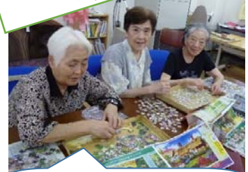
私たちパズルに夢中です！