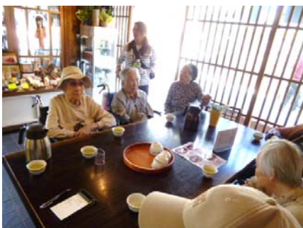
おやつには、もちろん梅が枝餅！デイサービスで作る梅が枝餅とどちらがおいしかったでしょうか？