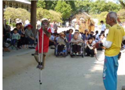
猿回しも見ました。