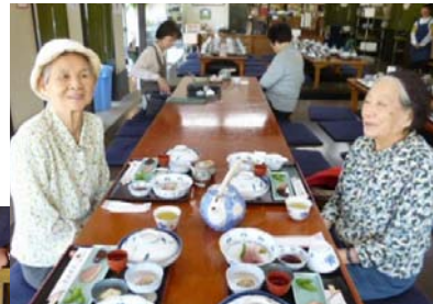
お昼は、お刺身に天ぷらたくさん種類がありました。