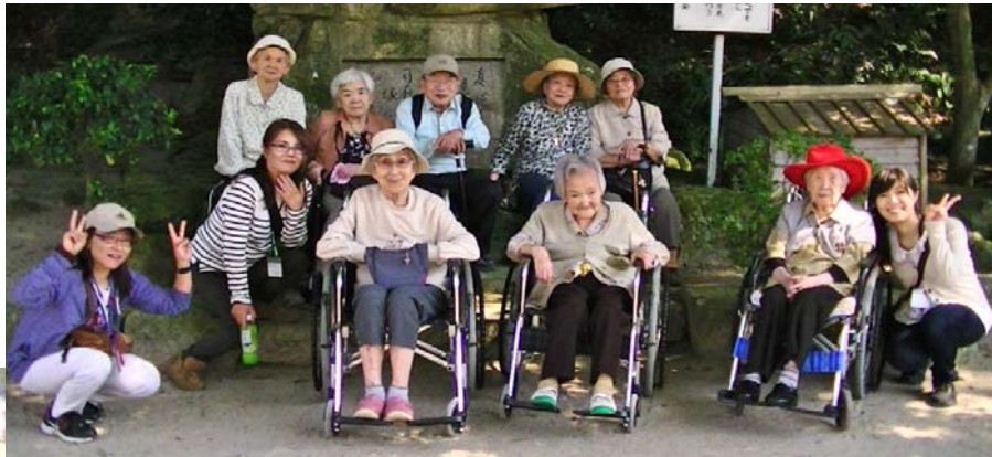
第1班の皆さんです。第2班・3班の方も楽しみにしてください！この日は暑いくらいのいいお天気で、木陰がちょうどよかったです。