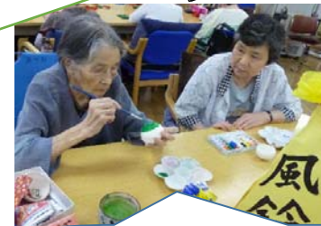
制作が好きな方はこちらへどうぞ！風鈴を作ったり、粘土で魚を作って魚釣りをしますよ！